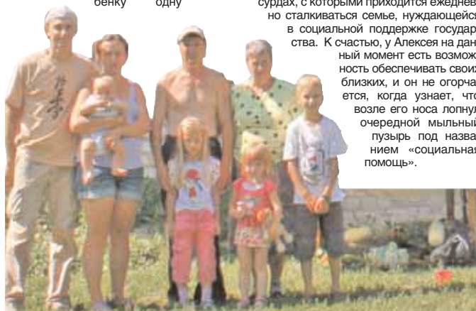
Все вместе у бабушки на даче