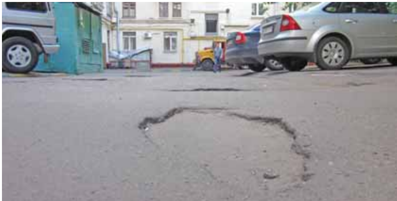
Ямы в пять сантиметров глубины

Во дворе вместо травки теперь один песок. Он попадает в