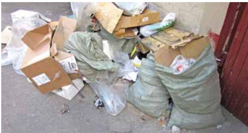
У подъезда постоянно скапливается мусор неизвестного происхождения