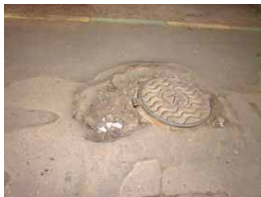
Не все лунные кратеры достигают глубины ям на Малой Грузинской