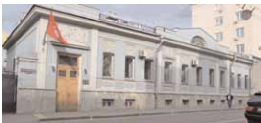
В бывшей резиденции Берии расположилось посольство Туниса (М. Никитская)