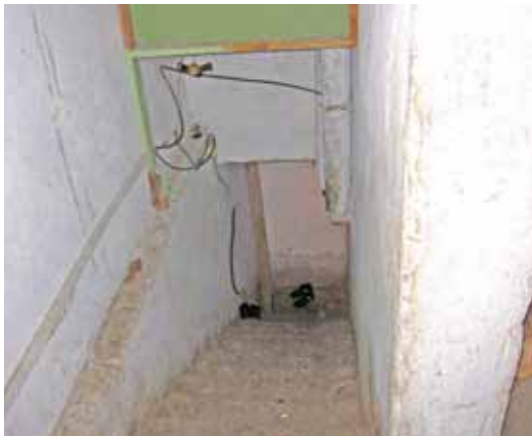
Подвал, в котором живут гастарбайтеры