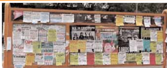
Этот жуткий стенд управы находится у северного выхода из метро «1905-го года»