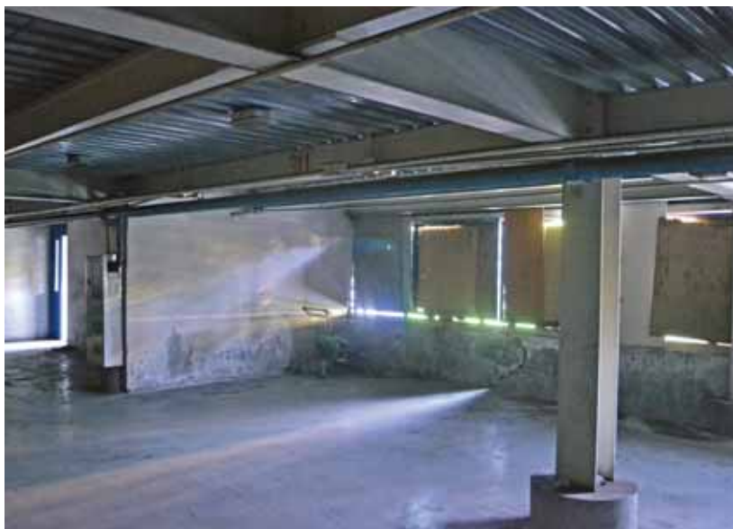
Вид изнутри. Электричества давно нет