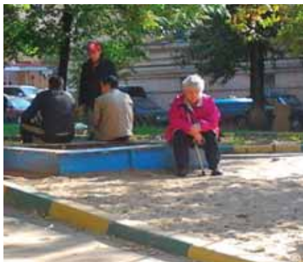
Найти, где присесть, задача не из легких

Сказать, что первое впечатление было удручающим, – ничего не сказать. Сразу закрутились мысли, как обозвать место нашего пребывания? Вариантов возникла куча: «Пресненская аномалия», «Дворовое гетто», «Зона отчуждения» и еще Бог знает что. Все дело в том, что районные благоустроители оставили этот двор нетронутым. Видимо, исходя из теории относительности, ну чтобы было с чем сравнивать.