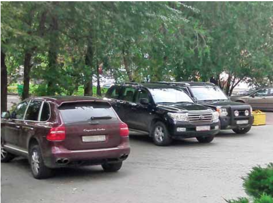
Стоянка рядом с управой Пресненского района. Автотранспорт сотрудников

ная часть, а ведь, возможно, есть и другая. Если вы разбираетесь в авто – посмотрите фото к данному материалу и прикиньте в уме, что даже при таких официальных доходах их хватит лишь на одну подобную машину, а ведь они на что-то ещё и живут. И отнюдь не бедствуют.