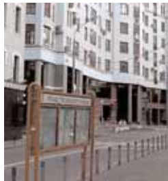
У дома мэра стоит убогий стенд Пресненской управы

Спокойно, Пресненская управа даже себя не ува-