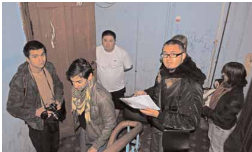
В гостях у нелегалов