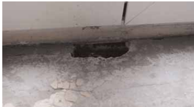
Огромные дыры похожи на парадный вход в крысиную обитель

Да, крысы тоже не с луны свалились – из мусоропровода вышли... Кстати, починку которого жильцы добивались не один месяц. Мусоропровод наконец-таки