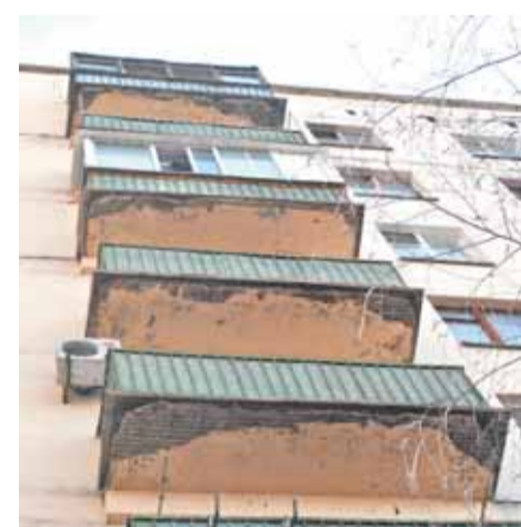
В этом году балконы ждут ремонта...

арматуры вместе с бетоном валяются с верхних этажей на нижние балконы.