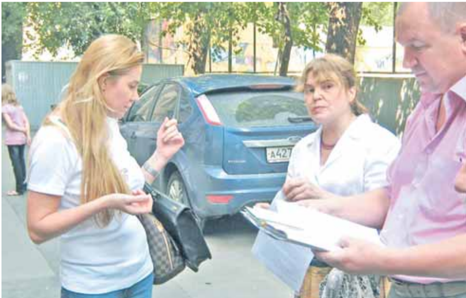
Шульсультман (слева) на очередной стычке с жильцами