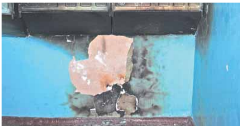
4-й подъезд дома 38 по ул. Красная Пресня