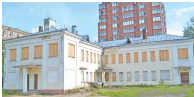
Бывший сад железной дороги

Спросите у любого молодого родителя, просто ли сейчас устроить ребенка в детский сад? Думается, ответ никого не удивит - сложно, и ещё как. Нужно найти приличное, желательно удобно расположенное дошкольное учреждение, заблаговременно встать в очередь, собрать огромное количество бумажек - и только тогда можно отдавать драгоценное чадо под надежный присмотр воспитателей. Хорошо, если все это удастся сделать без особых проблем, что для жителей Москвы практически невозможно. Почему? Всё просто - «mestov.net».