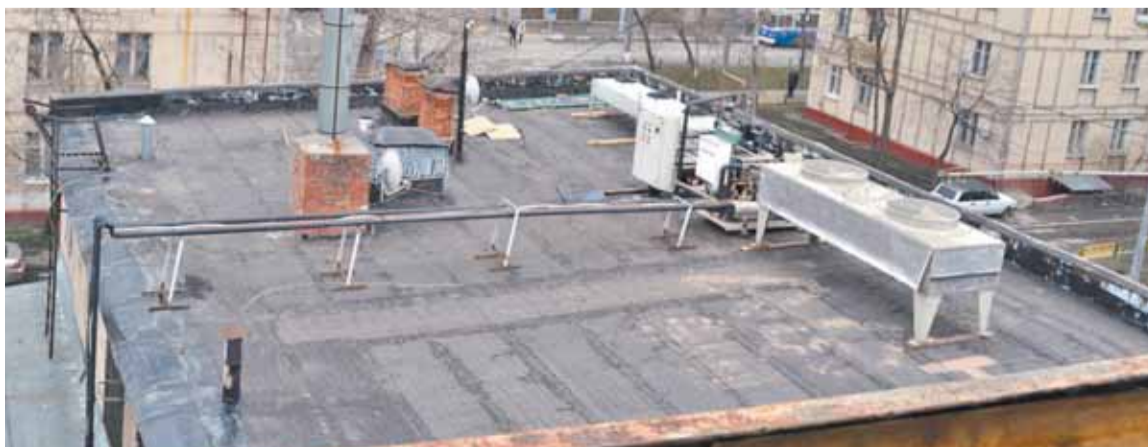
Та самая злополучная охлаждающая установка (снимок сделан из окна квартиры)

Но если с кафе в общем-то все понятно и жильцам дома № 10 теперь вновь предстоит бесконечные звонки в полицию, чтобы утихомиривать разгулявшихся гостей, то ситуация с круглосуточным магазином, открывшемся на первом этаже пристройки, хочется верить, будет урегулирована. Во всяком случае, люди очень на это надеются. Дело в том, что его арендаторы расположили на крыше пристройки охлаждающую установку с компрессором. И уж теперь-то жителям, чьи окна выходят как раз на эту крышу, покоя нет в прямом смысле ни днем, ни ночью: компрессор гудит, вентиляторы то включаются, то выключаются... А в ночные часы это становится просто невыносимым. Так что, в отличие от большинства наших граждан, жильцы дома с ужасом думают теперь о лете, уг-