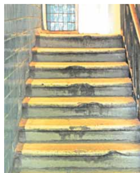
В подъезде дома 18

Конечно, жильцы дома 18 знают о программе софинансирования капитального ремонта. Но - в доме преимущественно живут пенсионеры. Откуда взять старикам такие средства? К тому же людям говорили, что деньги на ремонт дома уже были выделены. Резонный вопрос: куда же они делись?