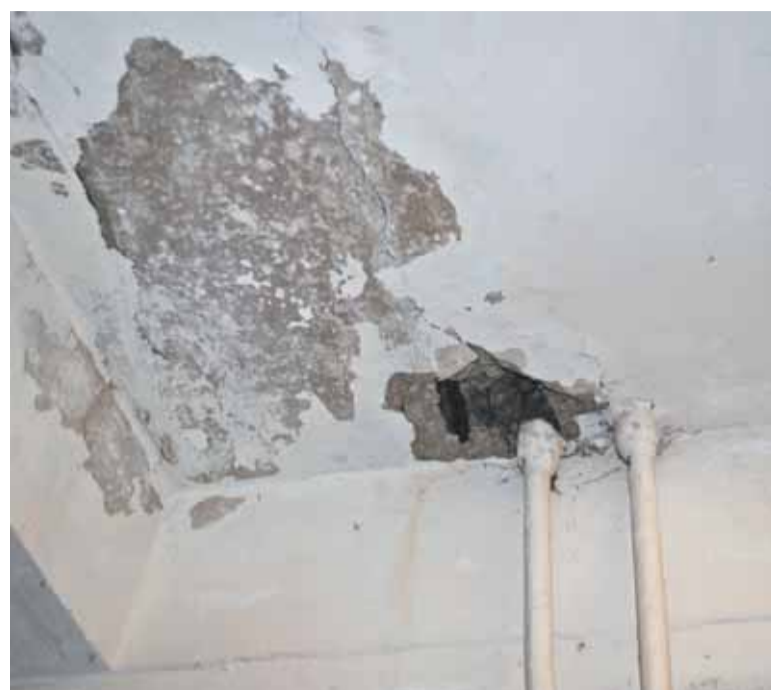
...но одной только покраской тут явно не обойтись

тех самых баллов. Однако заметим, что это не единственный критерий.