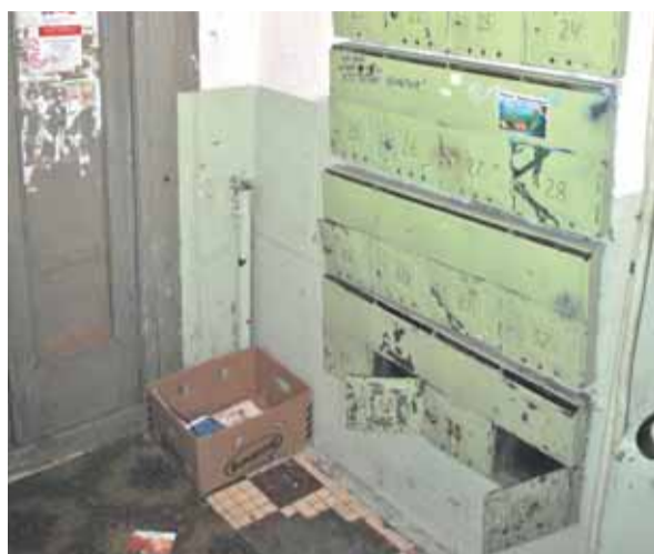
Подъезд дома 11 по ул. 1905 года, кажется, даже никогда не красили...