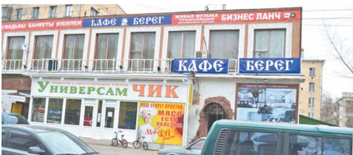
Прославившееся ночными гулянками кафе и магазин наводят ужас на жильцов дома № 10

да поневоле придется распахивать окна. И, по злому стечению обстоятельств, в квартирах, наиболее подверженных шуму, живут тяжелобольные люди. Впрочем, от такой жизни, думается, в скором времени к ним примкнут и те, кто еще ощущает себя более-менее здоровым. «Что же нам делать? - растерянно спрашивают измотанные непрекращающимся шумом жильцы дома в коллективном письме. - Мы уже пробовали пообщаться с руководством магазина, но оно на контакт не идет...»