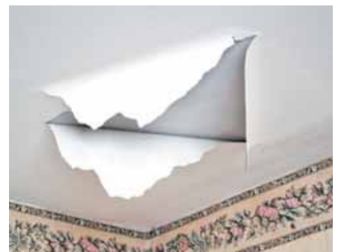
Потолок в одной из квартир дома 18 по Шмитовскому проезду

Мы побывали в одном из подобных домов нашего района. Дом 18 по Шмитовскому проезду не ремонтировался 50 лет с момента постройки. Грязно-желтая девятиэтажка стоит в одном ряду со сверкающими новенькими фасадами таких же типовых зданий. Именно поэтому