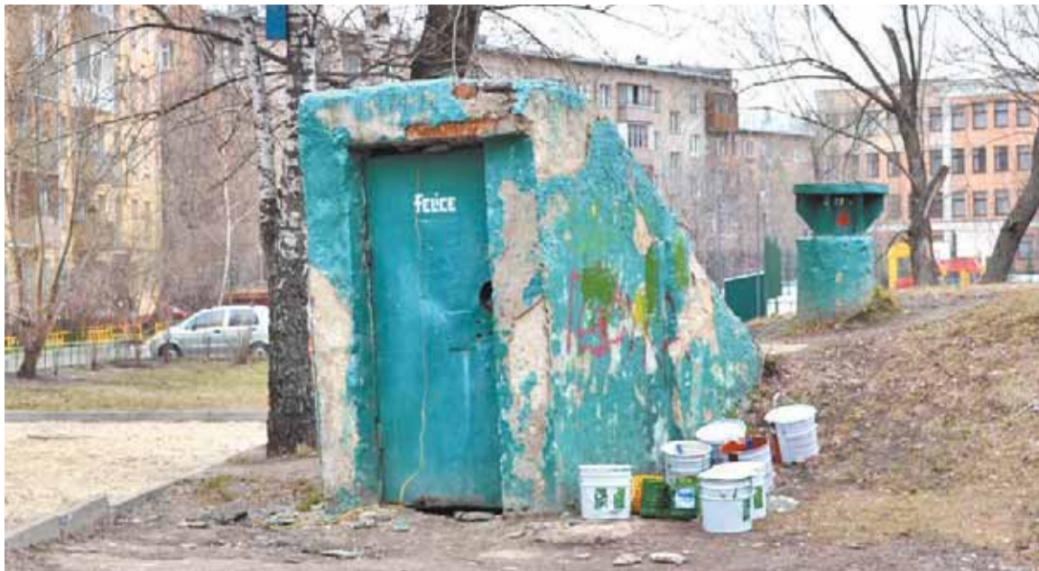
У входа в «общежитие» - емкости с краской