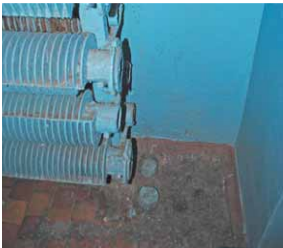
Лишь обрубки труб напоминают, что тут когда-то было отопление (ул. Красная Пресня, 38, 1-й подъезд)